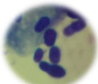
马拉セチア (酵母菌) ( ひょうたん型 が特徴)

外耳炎の原因の多くは、この菌です。普段は悪さをしません、 湿度や脂質を好み 、増殖し痒みを起こします。