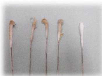
外耳・綿棒の汚れ