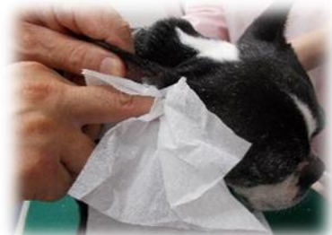
ご自宅での外耳ケアー