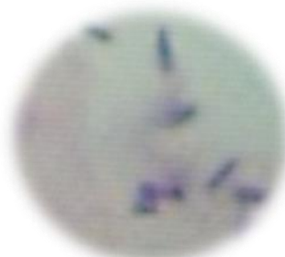
桿菌 ( 細長い菌 )

外耳炎の原因の多くは、この菌です。普段は悪さをしません、 湿度や脂質を好み 、増殖し痒みを起こします。